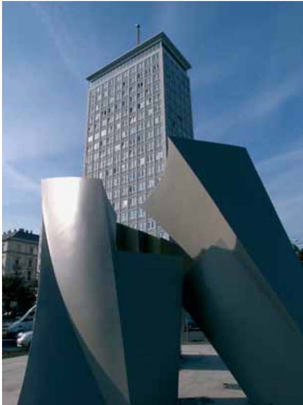
Der Ringturm – die Zentrale der Wiener Städtischen